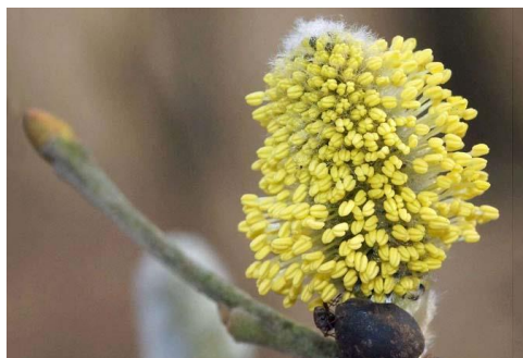
Männliche Weidenblüte mit Staubfäden