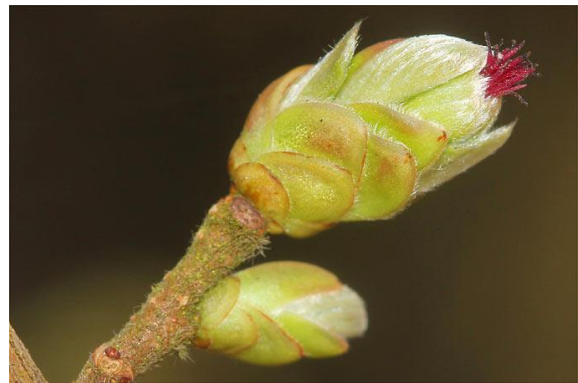
Weibliche Blüte etwas schwieriger zu entdecken