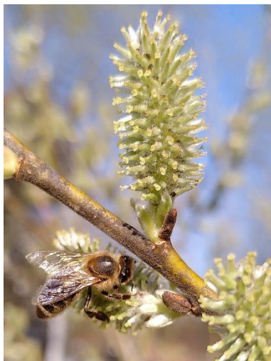
Weibliche Weidenblüte mit Stempeln

Es gibt ungefähr 450 Weidenarten auf der Welt - Bäume und Sträucher. Gemeinsam ist fast allen Arten, dass es männliche und weibliche Pflanzen gibt. Man nennt das zweihäusig. Sie sind auf die Bestäubung durch Insekten, vor allem durch die verschiedenen Bienenarten angewiesen. Die Bienen fliegen auf ihrer Suche nach Nektar, den beide Geschlechter produzieren, mal männliche und mal weibliche Blüten an und übertragen dabei den Pollen. Da kein Baum männliche und weibliche Blüten hat, ist eine Selbstbefruchtung ausgeschlossen.