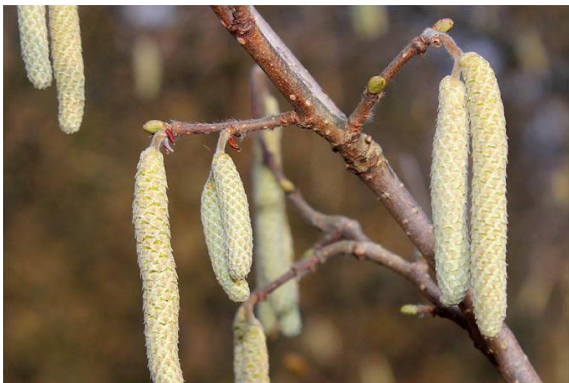
Männliche Blüte leicht zu finden

Findet ihr weibliche und männliche Blüten an einem Strauch?